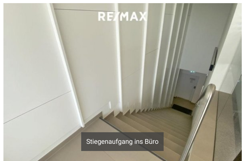
Stiegenaufgang ins Büro