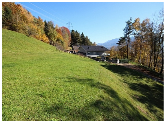
Schöner großer 2.727m 2 Grund in Ludmannsdorf-Bach