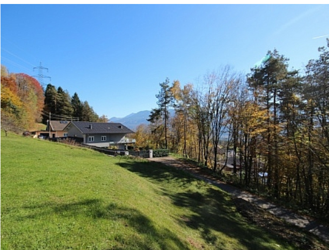
Schöner großer 2.727m 2 Grund in Ludmannsdorf-Bach