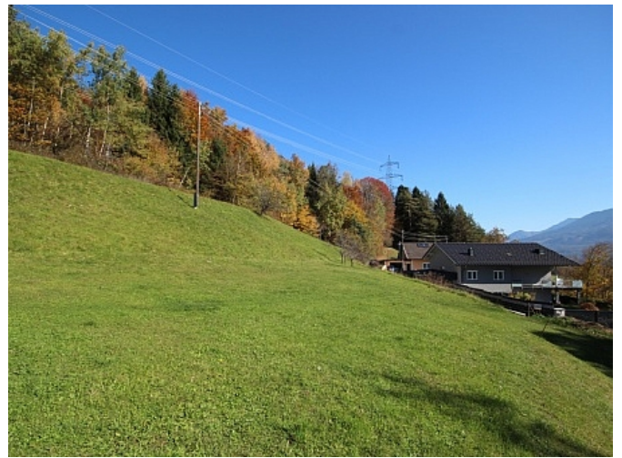
Schöner großer 2.727m 2 Grund in Ludmannsdorf-Bach