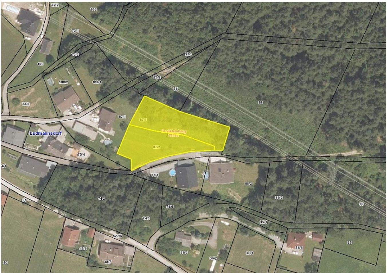
Schöner großer 2.727m 2 Grund in Ludmannsdorf-Bach