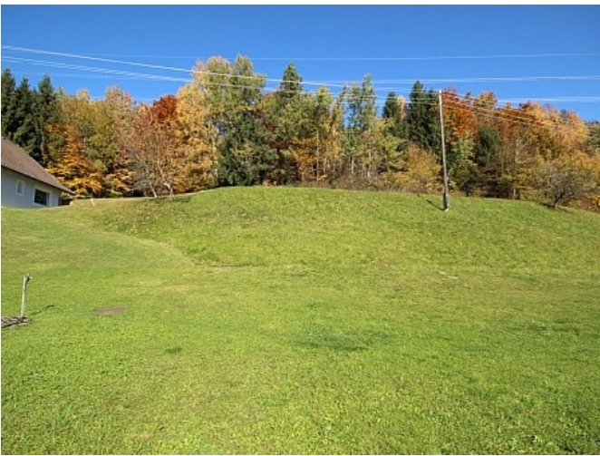
Schöner großer 2.727m 2 Grund in Ludmannsdorf-Bach