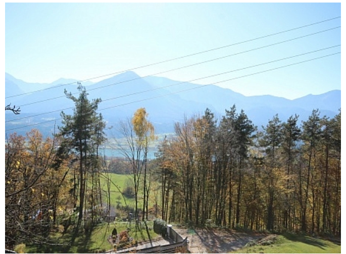
Schöner großer 2.727m 2 Grund in Ludmannsdorf-Bach