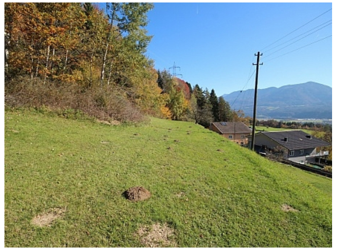
Schöner großer 2.727m 2 Grund in Ludmannsdorf-Bach