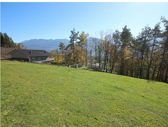
Schöner großer 2.727m 2 Grund in Ludmannsdorf-Bach