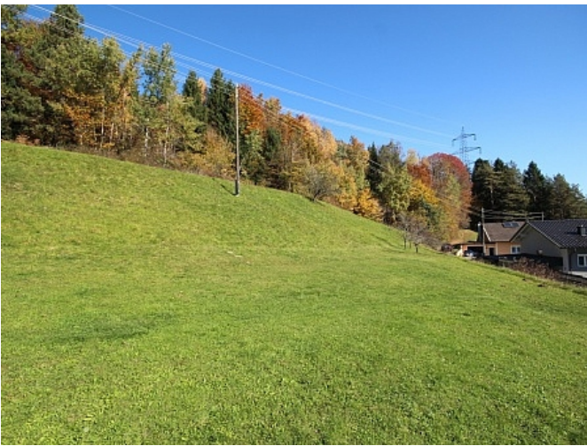
Schöner großer 2.727m 2 Grund in Ludmannsdorf-Bach