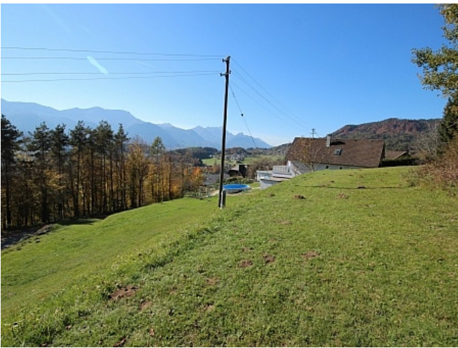
Schöner großer 2.727m 2 Grund in Ludmannsdorf-Bach