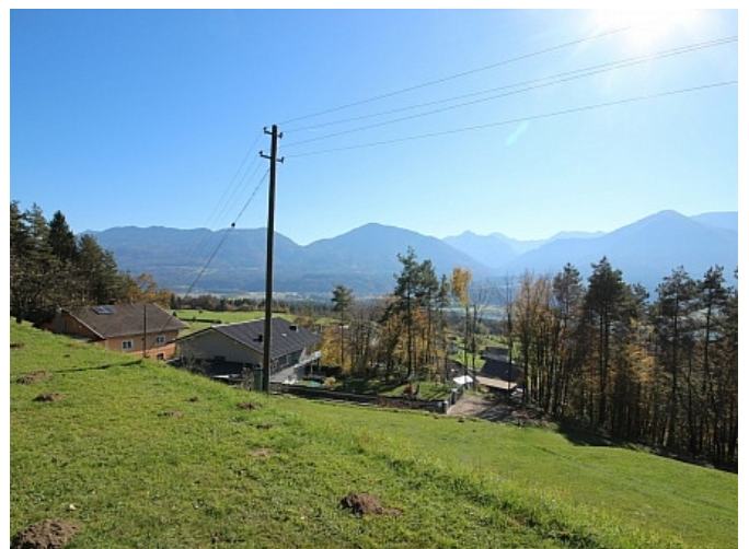
Schöner großer 2.727m 2 Grund in Ludmannsdorf-Bach