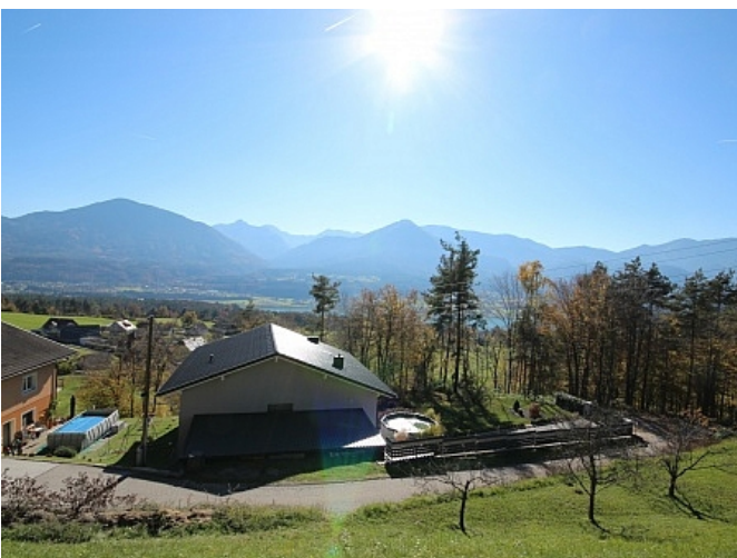
Schöner großer 2.727m 2 Grund in Ludmannsdorf-Bach