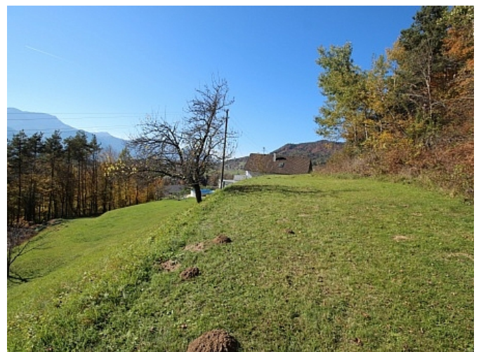
Schöner großer 2.727m 2 Grund in Ludmannsdorf-Bach