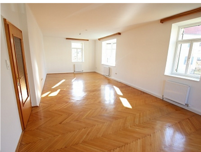
Neu sanierte 2 Zi Wohnung - Beethovenstrasse