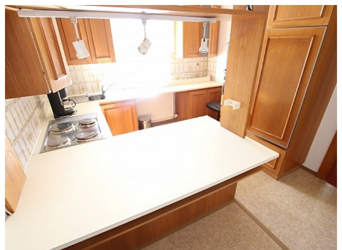
Neu sanierte 2 Zi Wohnung - Beethovenstrasse