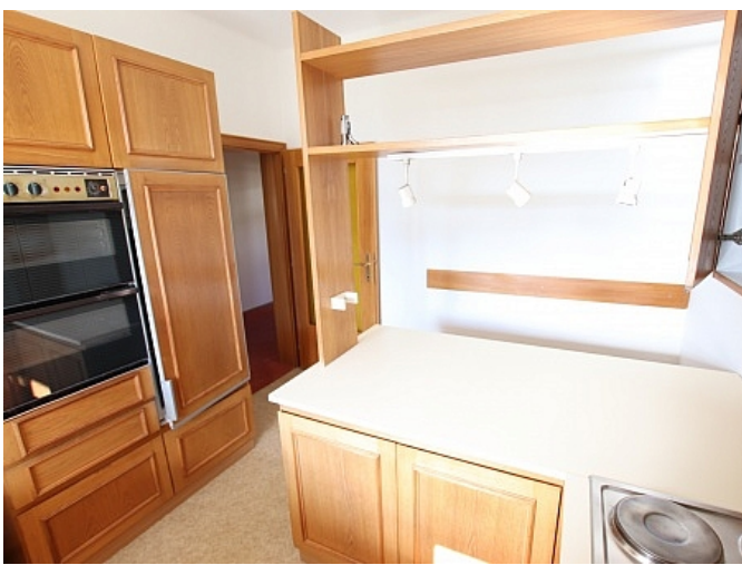
Neu sanierte 2 Zi Wohnung - Beethovenstrasse