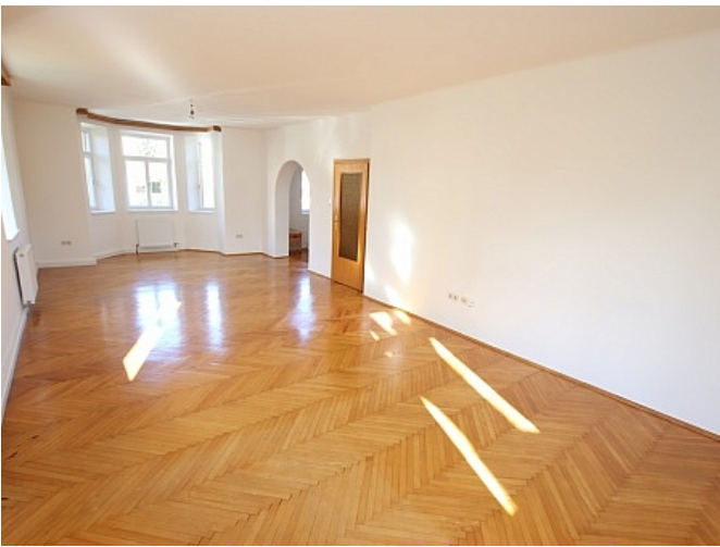
Neu sanierte 2 Zi Wohnung - Beethovenstrasse