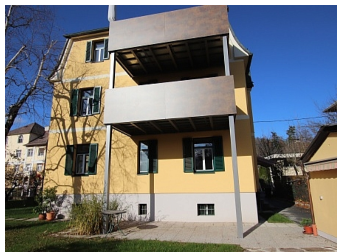
Neu sanierte 2 Zi Wohnung - Beethovenstrasse