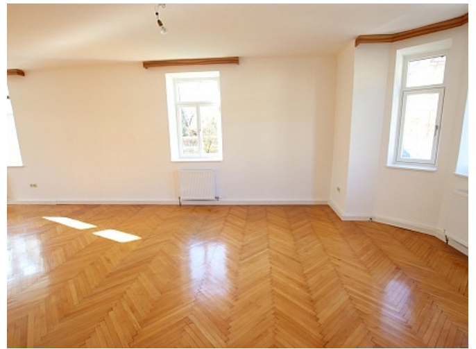
Neu sanierte 2 Zi Wohnung - Beethovenstrasse