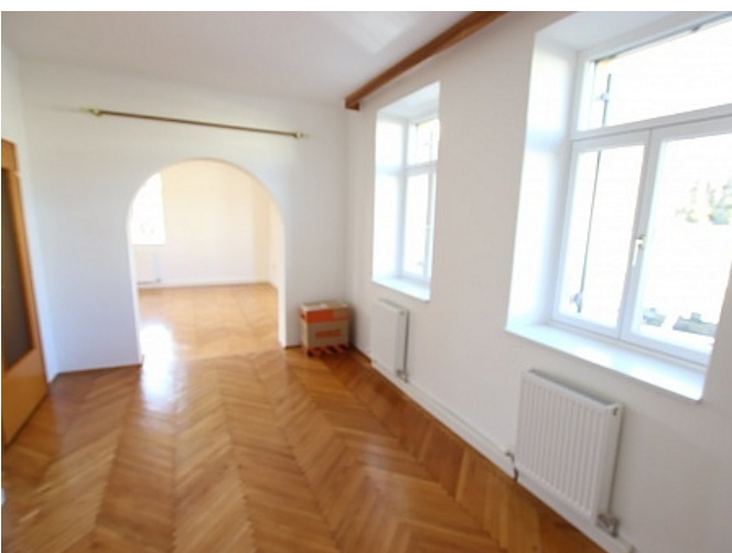
Neu sanierte 2 Zi Wohnung - Beethovenstrasse