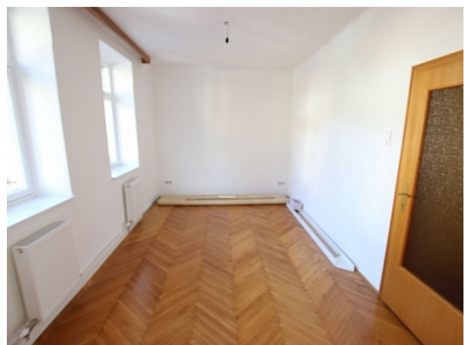
Neu sanierte 2 Zi Wohnung - Beethovenstrasse