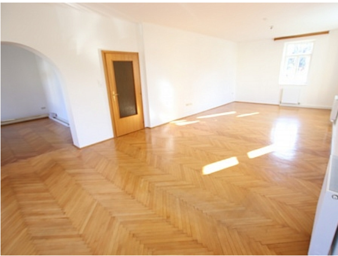
Neu sanierte 2 Zi Wohnung - Beethovenstrasse