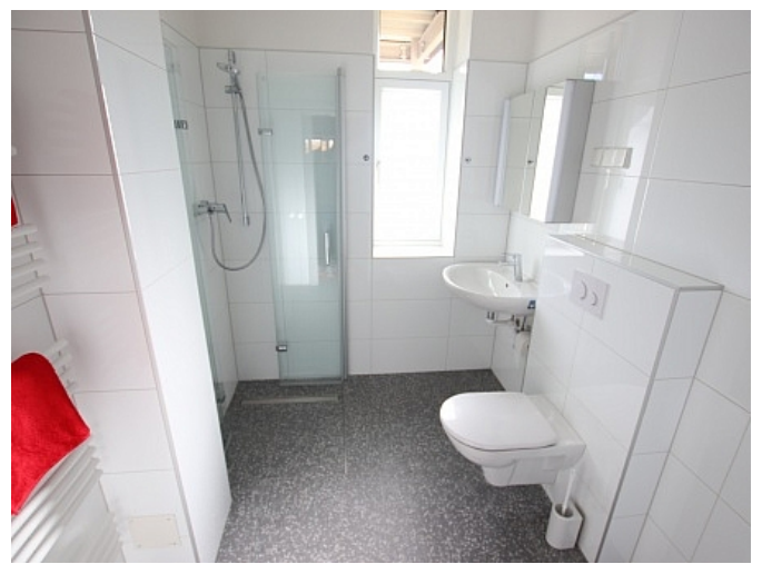
Neu sanierte 2 Zi Wohnung - Beethovenstrasse