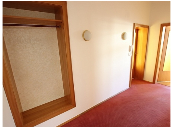
Neu sanierte 2 Zi Wohnung - Beethovenstrasse