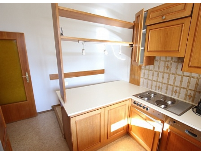
Neu sanierte 2 Zi Wohnung - Beethovenstrasse