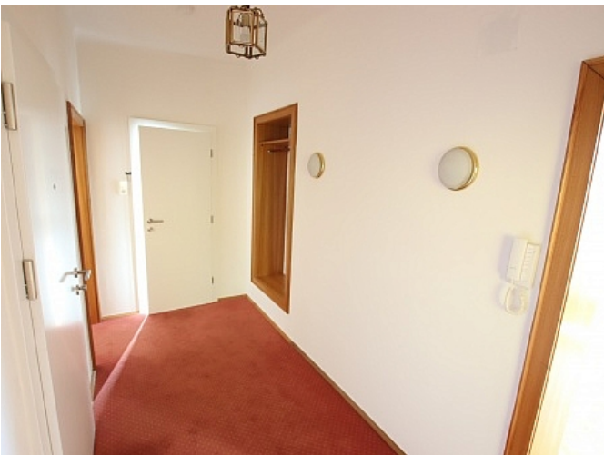
Neu sanierte 2 Zi Wohnung - Beethovenstrasse