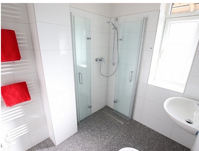
Neu sanierte 2 Zi Wohnung - Beethovenstrasse