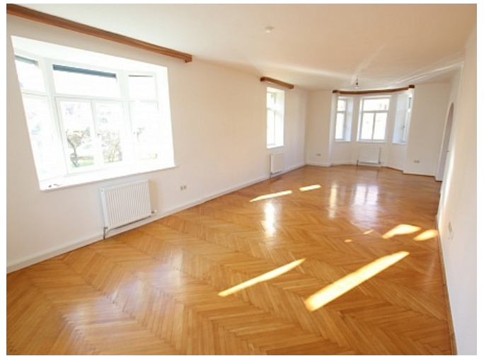
Neu sanierte 2 Zi Wohnung - Beethovenstrasse