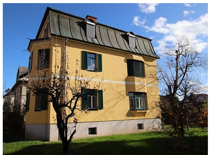
Neu sanierte 2 Zi Wohnung - Beethovenstrasse