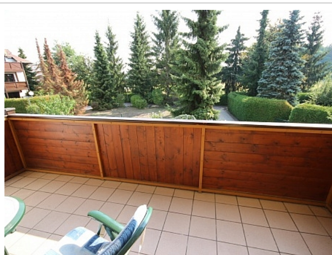
Schöne Garconniere 50m 2 in Waidmannsdorf