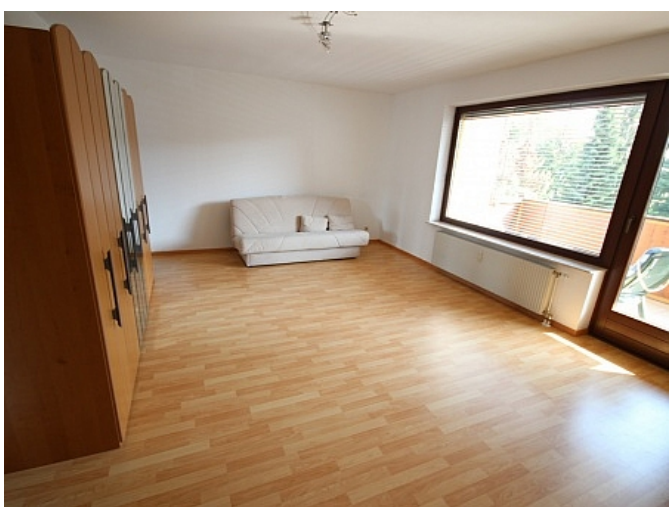
Schöne Garconniere 50m 2 in Waidmannsdorf