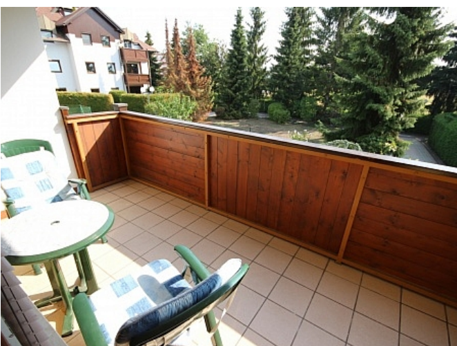
Schöne Garconniere 50m 2 in Waidmannsdorf