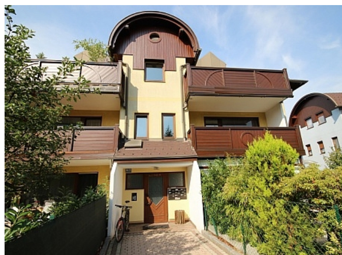
Schöne Garconniere 50m 2 in Waidmannsdorf