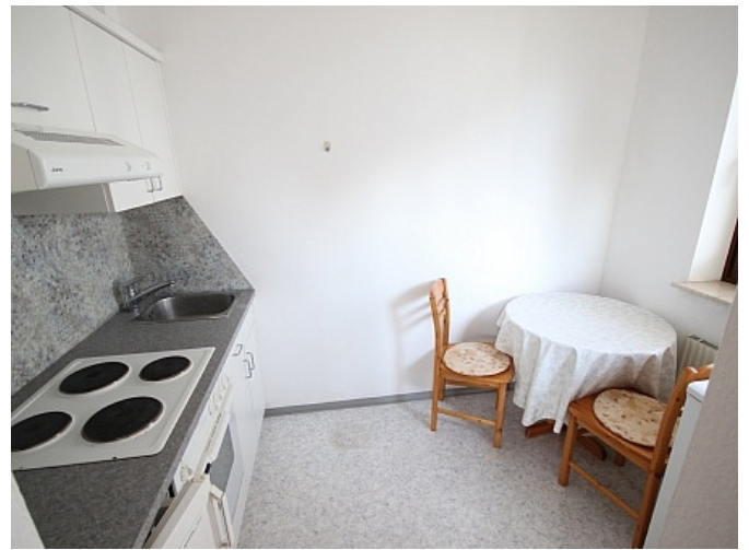
Schöne Garconniere 50m 2 in Waidmannsdorf