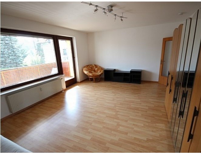
Schöne Garconniere 50m 2 in Waidmannsdorf