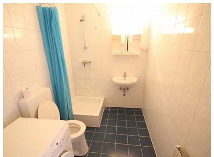
Schöne Garconniere 50m 2 in Waidmannsdorf