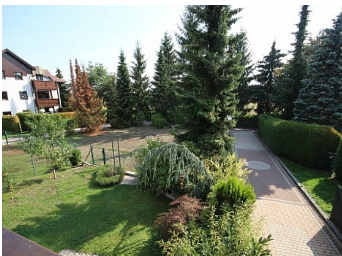
Schöne Garconniere 50m 2 in Waidmannsdorf