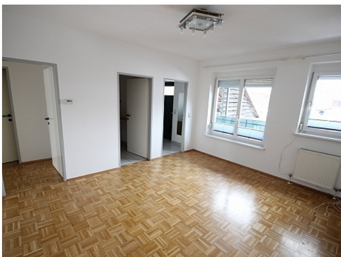
Schöne 2 Zi Wohnung in Tessendorf