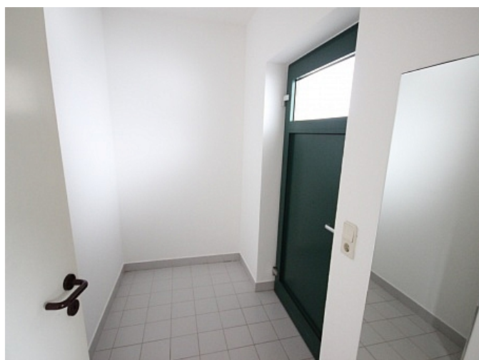
Schöne 2 Zi Wohnung in Tessendorf