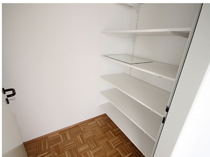
Schöne 2 Zi Wohnung in Tessendorf