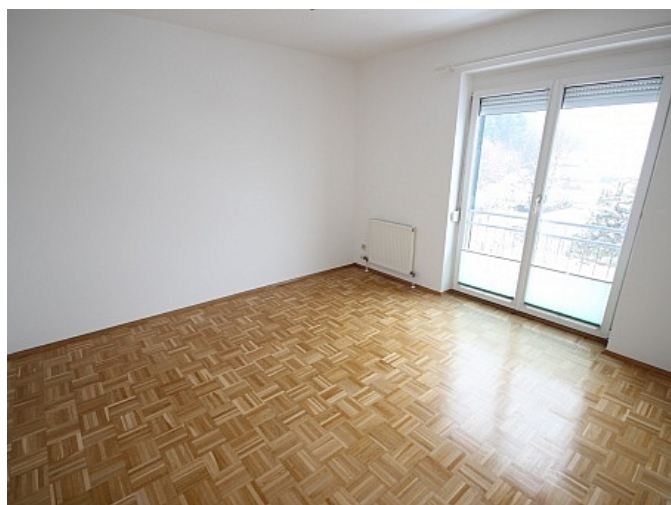
Schöne 2 Zi Wohnung in Tessendorf