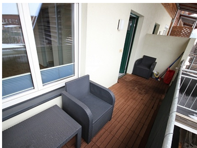
Schöne 2 Zi Wohnung in Tessendorf