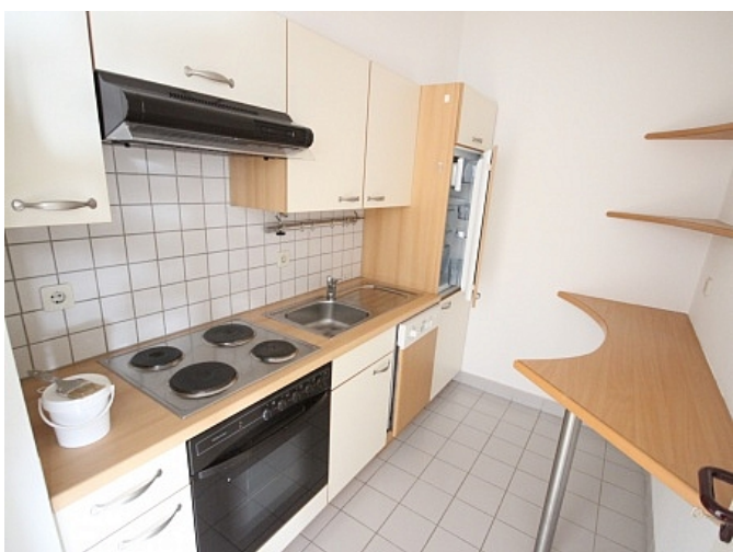
Schöne 2 Zi Wohnung in Tessendorf