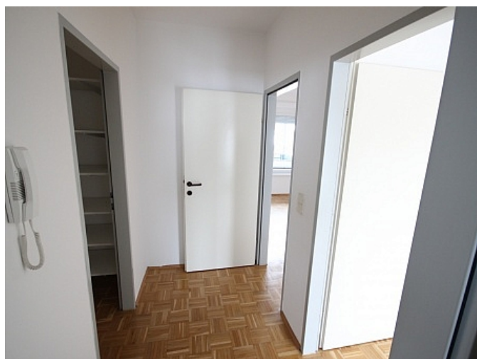
Schöne 2 Zi Wohnung in Tessendorf