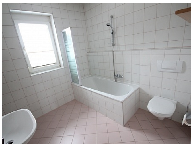
Schöne 2 Zi Wohnung in Tessendorf