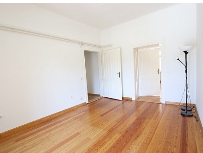
Tolle 101m 2 - 4 Zi Altbauwohnung - Mariannengasse