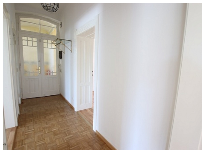
Tolle 101m 2 - 4 Zi Altbauwohnung - Mariannengasse