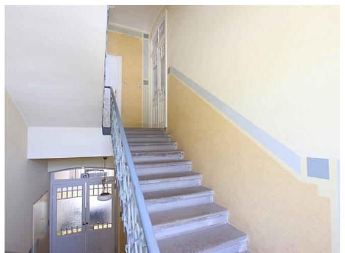
Tolle 101m 2 - 4 Zi Altbauwohnung - Mariannengasse