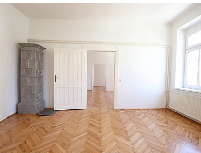
Tolle 101m 2 - 4 Zi Altbauwohnung - Mariannengasse