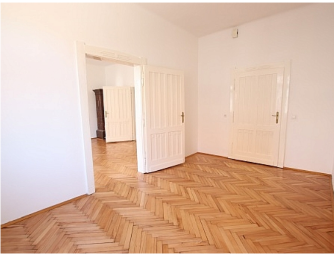
Tolle 101m 2 - 4 Zi Altbauwohnung - Mariannengasse