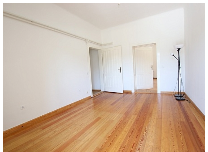
Tolle 101m 2 - 4 Zi Altbauwohnung - Mariannengasse