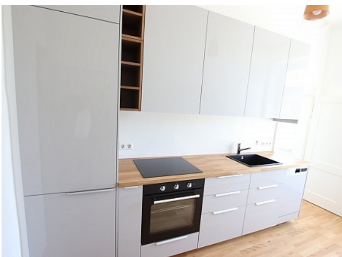
Tolle 101m 2 - 4 Zi Altbauwohnung - Mariannengasse