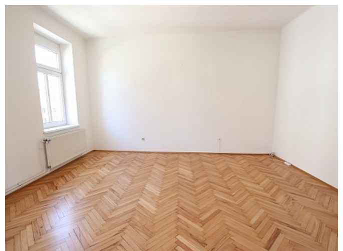
Tolle 101m 2 - 4 Zi Altbauwohnung - Mariannengasse