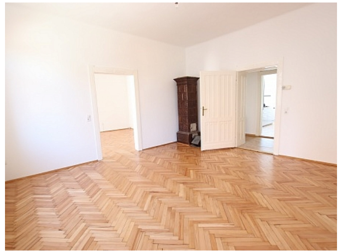
Tolle 101m 2 - 4 Zi Altbauwohnung - Mariannengasse