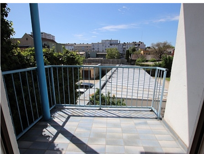
Tolle 101m 2 - 4 Zi Altbauwohnung - Mariannengasse