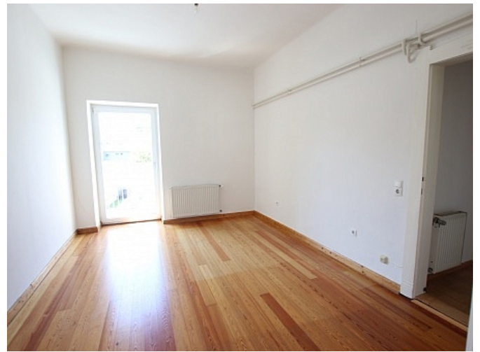
Tolle 101m 2 - 4 Zi Altbauwohnung - Mariannengasse