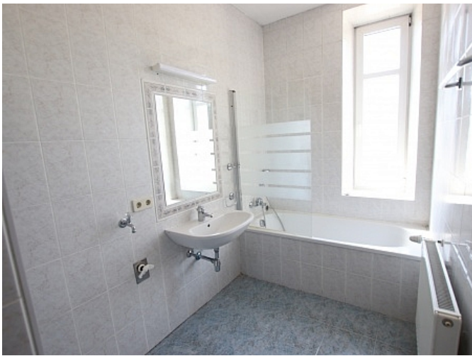
Tolle 101m 2 - 4 Zi Altbauwohnung - Mariannengasse