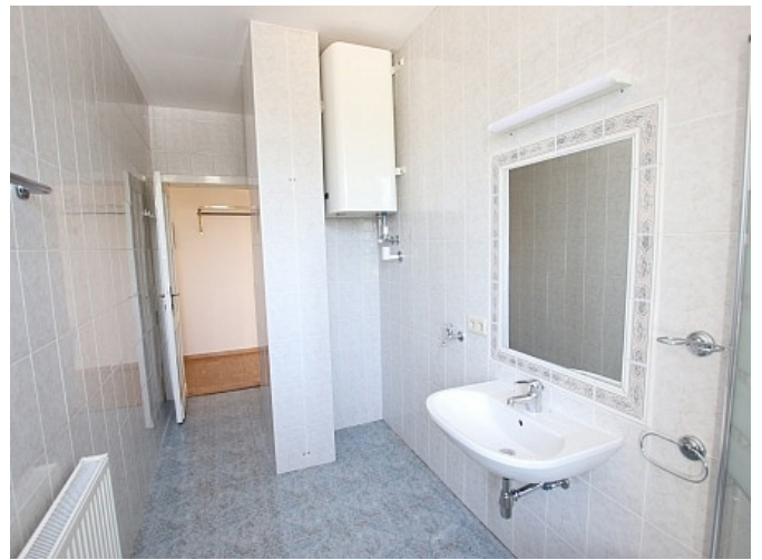
Tolle 101m 2 - 4 Zi Altbauwohnung - Mariannengasse