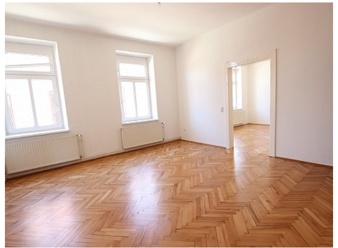
Tolle 101m 2 - 4 Zi Altbauwohnung - Mariannengasse