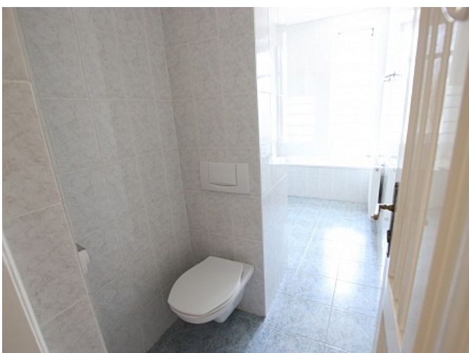
Tolle 101m 2 - 4 Zi Altbauwohnung - Mariannengasse