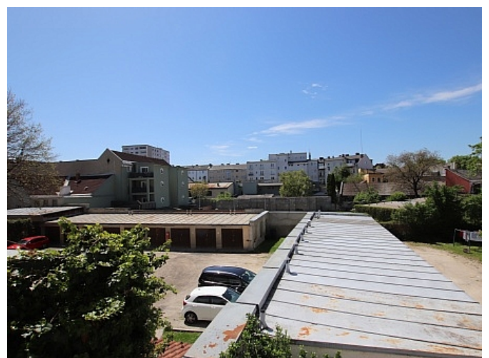
Tolle 101m 2 - 4 Zi Altbauwohnung - Mariannengasse