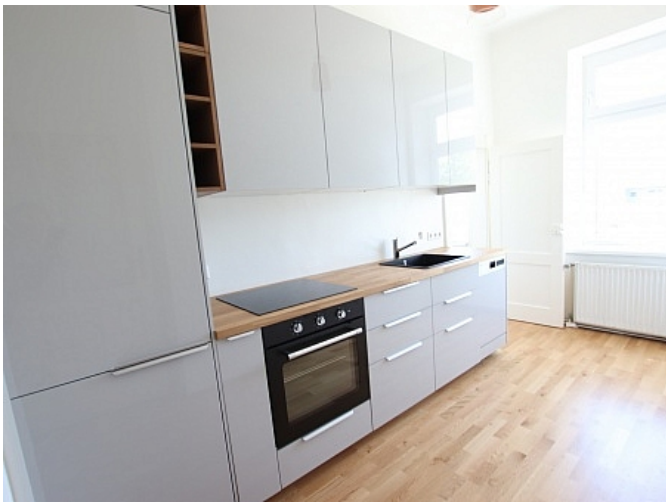
Tolle 101m 2 - 4 Zi Altbauwohnung - Mariannengasse