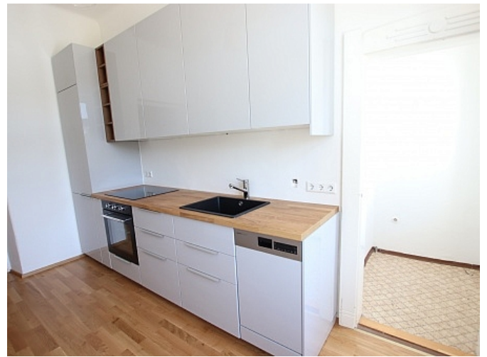
Tolle 101m 2 - 4 Zi Altbauwohnung - Mariannengasse