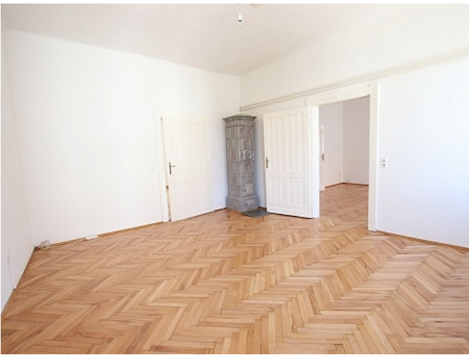
Tolle 101m 2 - 4 Zi Altbauwohnung - Mariannengasse