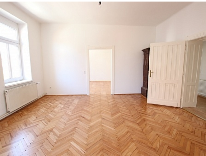
Tolle 101m 2 - 4 Zi Altbauwohnung - Mariannengasse