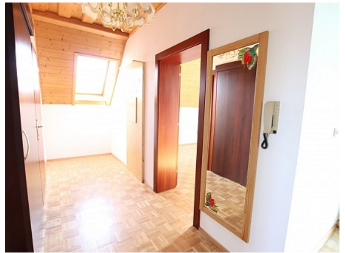
Tolle 150m 2 Penthousewohnung in Klagenfurt