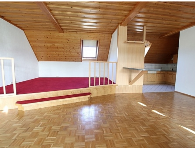
Tolle 150m 2 Penthousewohnung in Klagenfurt