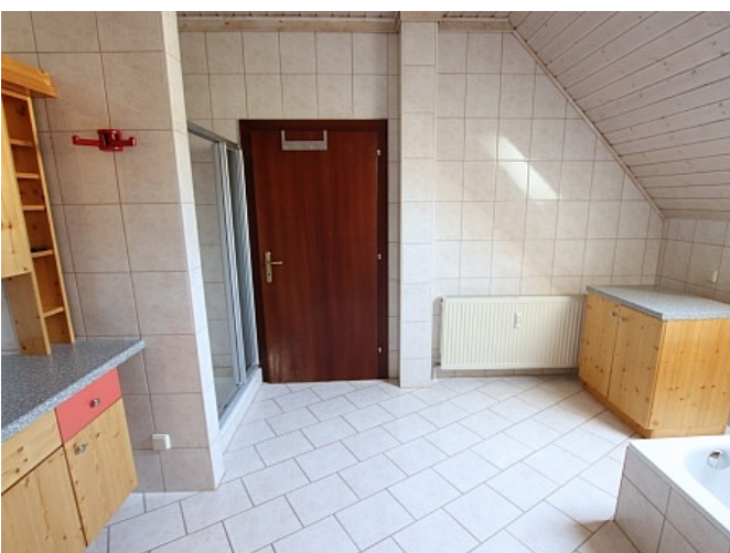
Tolle 150m 2 Penthousewohnung in Klagenfurt