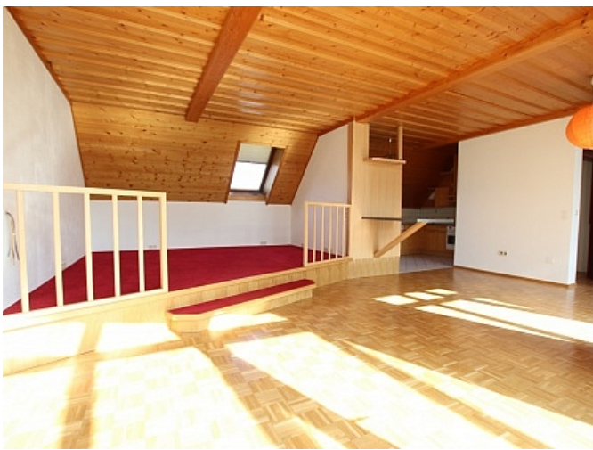
Tolle 150m 2 Penthousewohnung in Klagenfurt