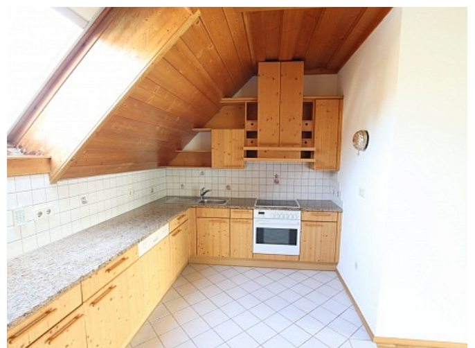
Tolle 150m 2 Penthousewohnung in Klagenfurt