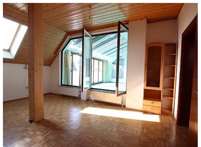
Tolle 150m 2 Penthousewohnung in Klagenfurt