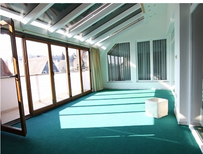
Tolle 150m 2 Penthousewohnung in Klagenfurt