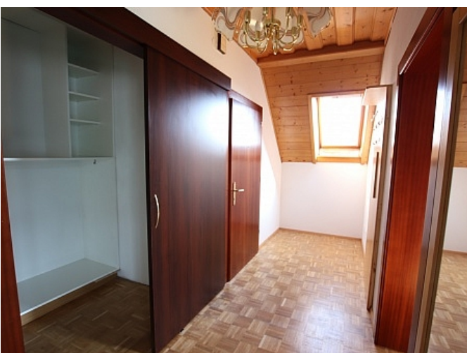
Tolle 150m 2 Penthousewohnung in Klagenfurt