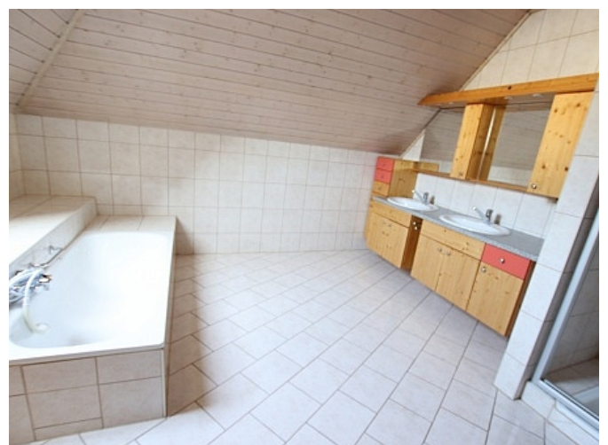
Tolle 150m 2 Penthousewohnung in Klagenfurt