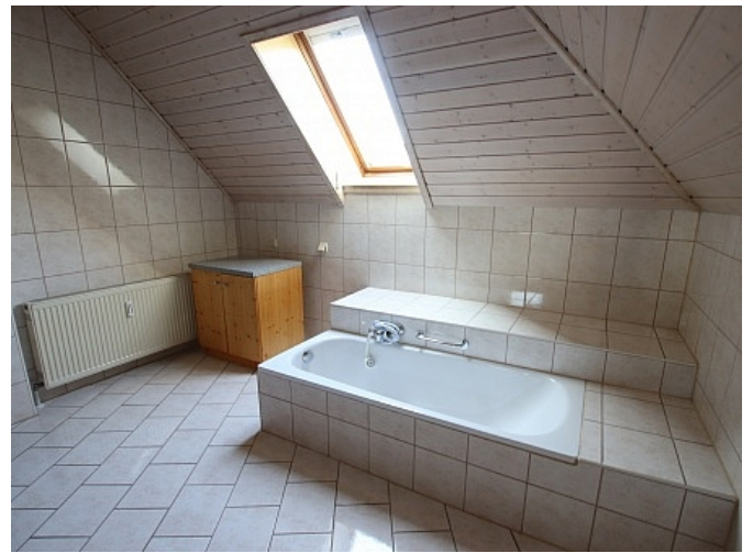
Tolle 150m 2 Penthousewohnung in Klagenfurt