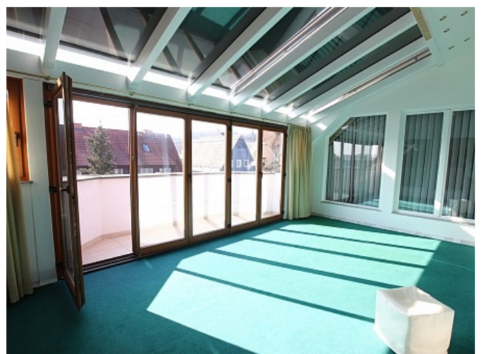
Tolle 150m 2 Penthousewohnung in Klagenfurt