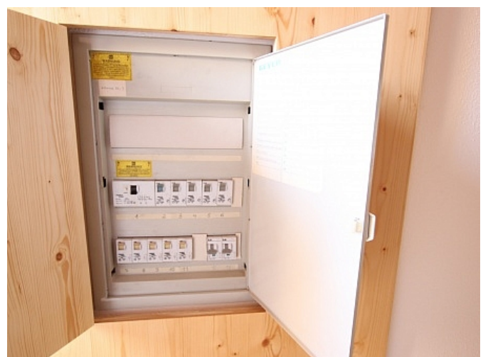
Tolle 150m 2 Penthousewohnung in Klagenfurt