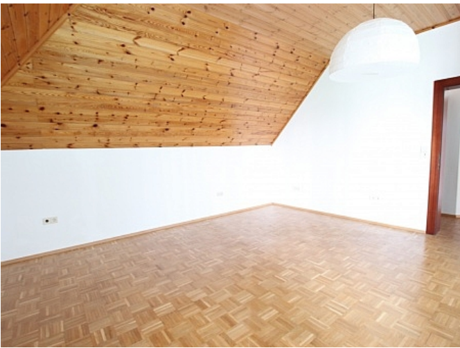
Tolle 150m 2 Penthousewohnung in Klagenfurt