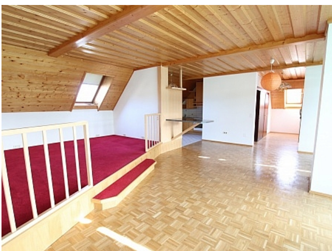
Tolle 150m 2 Penthousewohnung in Klagenfurt