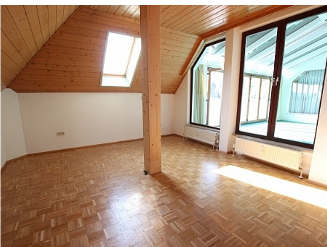
Tolle 150m 2 Penthousewohnung in Klagenfurt