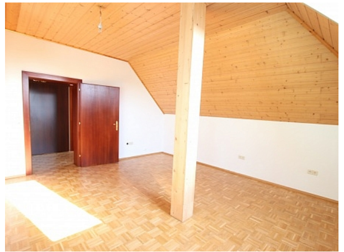
Tolle 150m 2 Penthousewohnung in Klagenfurt