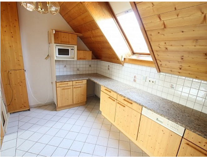
Tolle 150m 2 Penthousewohnung in Klagenfurt