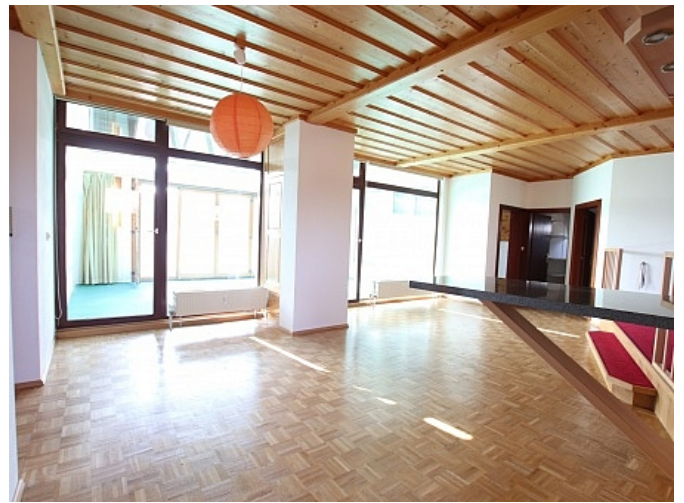
Tolle 150m 2 Penthousewohnung in Klagenfurt