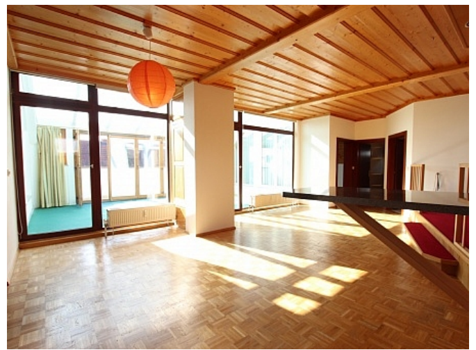
Tolle 150m 2 Penthousewohnung in Klagenfurt