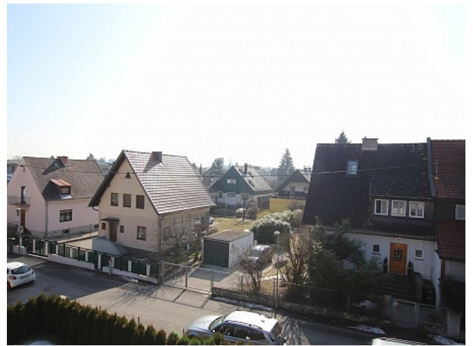
Tolle 150m 2 Penthousewohnung in Klagenfurt